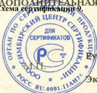
Схема сертификации 9.