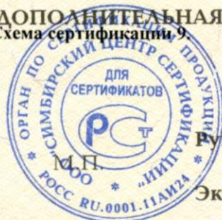
Схема сертификации 9