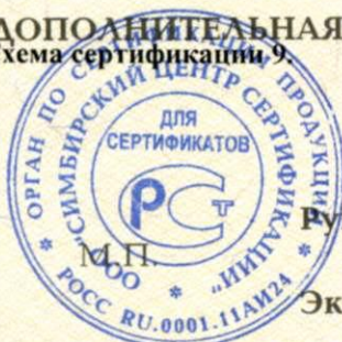
Схема сертификации 9