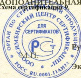
Схема сертификации 9.